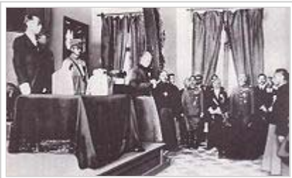
滿洲國執政就任式

滿洲國軍政部最高顧問。18日，發布《獨立宣言》：「從即日起宣佈滿蒙地區同中國中央政府脫離關係，根據滿蒙居民的自由選擇與呼籲，滿蒙地區從此實行完全獨立，成立完全獨立自主之政府。」23日，坂垣在撫順與溥儀會面，告知溥儀出任滿洲國執政。原本以為能夠重登帝位的溥儀儘管對於「執政」的安排甚為失望，但只能接受。