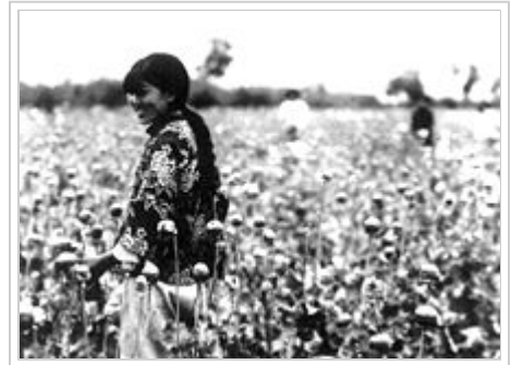
北滿地區收穫鴉片

滿洲地區年產糧食約2000萬噸左右，其中必須優先供應日軍和滿軍的軍事用糧、日本與朝鮮移民的口糧以及對日出口。根據關東軍的要求，滿洲國每年要向日本提供1000萬噸以上的糧食，每年8月中旬開始徵糧工作，11月底結束。除去來年的種子之後，中國農民的口糧所剩無幾。由於糧食供應不足，當局規定中國人不允許運輸、食用大米、白面，只能食用由玉米、小米、甚至榆樹籽和鋸末混合磨成的「協和麵」，違者按照「經濟犯」治罪。而日本開拓團移民不僅不需要交納農業稅費，還能按月領取口糧。