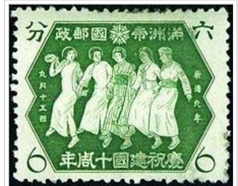
滿洲國郵票-為1942年9月15日發行的「慶祝建國十週年」紀念郵票的第二枚，圖案是漢滿日朝蒙五族少女攜手行進圖，上方有蘭花禦紋章和銘記。

滿洲國郵票在設計風格上糅合了滿、日兩國的因素，政治意味比較濃厚，見證了滿洲國政權的興亡歷史。郵票的圖案及標語體現了滿洲獨特的自然和文化、人文景觀和風土人情，也擔負起宣揚政治理念及意識型態的作用。