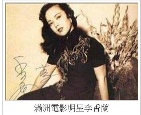
滿洲電影明星李香蘭

1937年8月，「株式會社滿洲映畫協會」在新京成立，簡稱「滿映」。在滿映存在的八年裡，共拍攝故事片108部，教育片、紀錄片189部。著名演員有李香蘭（山口淑子）、劉恩甲、浦克、張奕、於洋和凌元，導演內田吐夢、朱文順，攝影師王啟民，以及後來從影的方化等。著名影片有《碧血艷影》、《迎春花》、《蜜月快車》、《支那之夜》等。