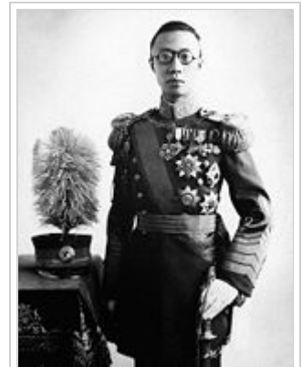
滿洲國皇帝愛新覺羅·溥儀

1931年滿洲事變時，張學良部隊因受制於蔣介石的命令不戰而退，放棄滿洲。但馬占山以三個旅的兵力抵抗日本軍，史稱江橋抗戰。滿洲國成立後，當地反日民眾與組織先後成立了東北抗日義勇軍、東北反日游擊隊、東北抗日同盟軍。1936年2月，中國共產黨駐共產國際代表團擬定《東北抗日聯軍統一軍隊建制宣言》。至1937年，東北抗日聯軍整合原反日游擊隊、救國軍、抗日自衛軍、抗日山林隊等抗日武裝，共編成11個軍。7月，抗日聯軍發展到45000餘人，達到人數上的頂峰。11月，抗日聯軍重新編成三路軍，分別以楊靖宇、周保中和李兆麟為各路軍的總指揮。抗日聯軍對滿洲國軍和關東軍進行小規模的游擊戰騷擾，被滿洲國政府視為「治安之癌」。日滿聯軍以大批部隊圍剿抗日聯軍，並以重金誘降。為切斷抗日聯軍的供應，日軍實施「三年治安肅正計劃」，及「保甲連座」、「集家並屯」等政策。從1939年開始，抗日聯軍由於給養斷絕、人員叛變、戰鬥人員不斷傷亡、逃跑，而處於極險惡的境地。1940年2月，一路軍總指揮楊靖宇在逃亡中被當地農民趙廷喜告發，在密林中與日滿軍警周旋數日後戰死。1941年，部分抗日聯軍潰退蘇聯境內。1942年8月，蘇聯將第一路、第二路、第三路軍改編成東北抗日聯軍教導旅，由周保中任旅長。這些人員在1945年8月作為蘇軍返回滿洲。